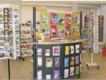
Un de nos 2 points d'accueil