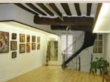
Notre salle d'exposition à l'antenne