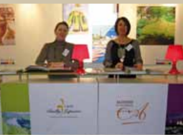
Sur le salon des Vacances à Bruxelles