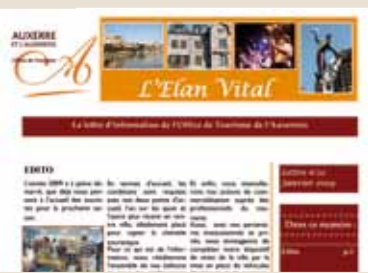
Notre lettre d'informations