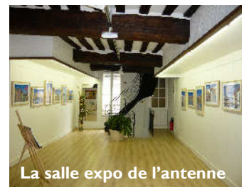
La salle expo de l'antenne