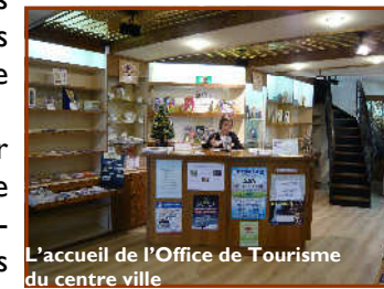
L'accueil de l'Office de Tourisme du centre ville

Pour ce qui est de l'information, nous rééditerons l'ensemble de nos éditions et nous les renforcerons par une information in situ grâce à la mise en place d'un écran, qui diffusera de l'information sur notre territoire et sur les manifestations à venir.