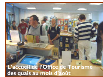
L'accueil de l'Office de Tourisme des quais au mois d'août

L'année 2009 a à peine démarré, que déjà nous pensons à l'accueil des touristes pour la prochaine saison.