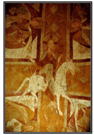
Die Kathedrale Saint Etienne