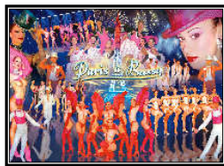
La Coupole des Anges

SUNDERANGEBOT Von 1. November bis 31. März - 15% Unterbringung in Hotel ** - 10% Unterbringung in Hotel ***