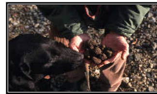
Trüffel von Burgund