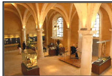
Das Archäologie-Museum in Die Abtei Saint Germain

In den restaurierten Klostergebäude sind die Kollektionen der Stadt Auxerre ausgestellt und in den ehemaligen Schlafsälen (17. Jh.) die prähistorischen und gallorömischen Archäologie-Sammlungen. In vier neuen Sälen befinden sich die mittelalterlichen Sammlungen. Es finden dort ebenfalls zeitweilige Ausstellungen statt.