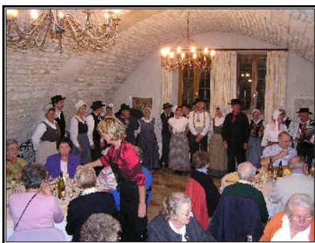
Burgundisches Abendessen im Domaine Borgnat