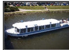
Hirondelle II

➔ 109 Kms :Ruche Gourmande oder 75 Kms :Coupole des Anges