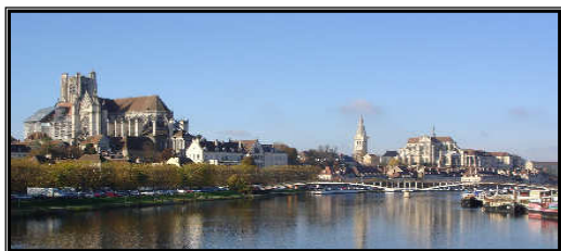
Die Kathedrale Saint Etienne und die Abtei Saint Germain

Im Laufe ihrer Besichtigung können Sie die sehr schöne Kirche entdecken, aber auch ein wunderschönes Kloster (17.-18. Jh.) sowie verschiedene Gebäudeteile aus dem 18. Jh. (Mönchssaal, Sakristei und Keller). Und schließlich wird Sie die Aufwertung der erst vor kurzem wiederentdeckten Krypten aus dem 9. Jahrhundert die besondere Stimmung dieses Ortes fühlen lassen.