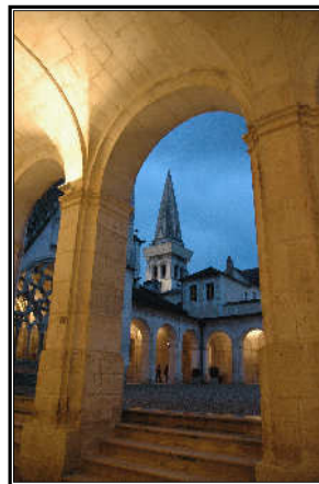
Die Abtei Saint Germain

Gültigkeit: Täglich außer dienstags und an bestimmten Feiertagen.