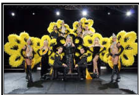
La Ruche Gourmande

Rückkehr ins Hotel in dem Ende der Show.